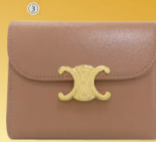
③<セリーヌ> 財布 USED 1点限り 税込 55,000円