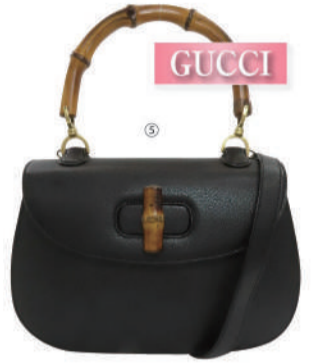
⑤(グッチ) パンブー2Wayバッグ USED 1点限り 税込 130,000円