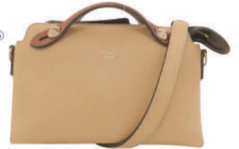
⑥(フェンディ) バイザウェイミニ USED 1点限り 税込 100,000円