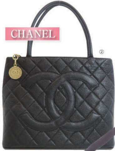
②(シャネル) 復刻トート USED 1点限り 税込 200,000円