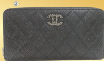
②<シャネル> ラウンドファスナー財布 USED 1点限り 税込 98,000円