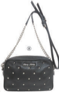
⑧(ミュウミュウ) ショルダー USED 1点限り 税込 76,000円