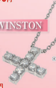
④<ハリーウィンストン> ミニクロス ネックレス (Pt950/ダイヤ) USED 1点限り 税込 278,000円