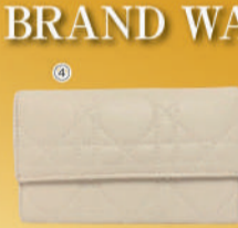
④<クリスチャン・ディオール> キーケース USED 1点限り 税込 22,000円