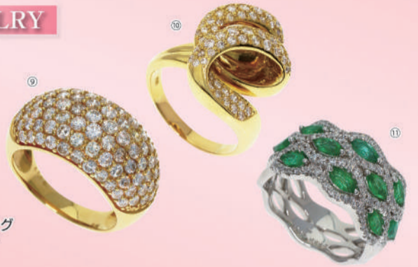
⑪K18WG エメラルド/ダイヤリング (E:1.24ct/D:0.62ct/#13) 税込 480,000円