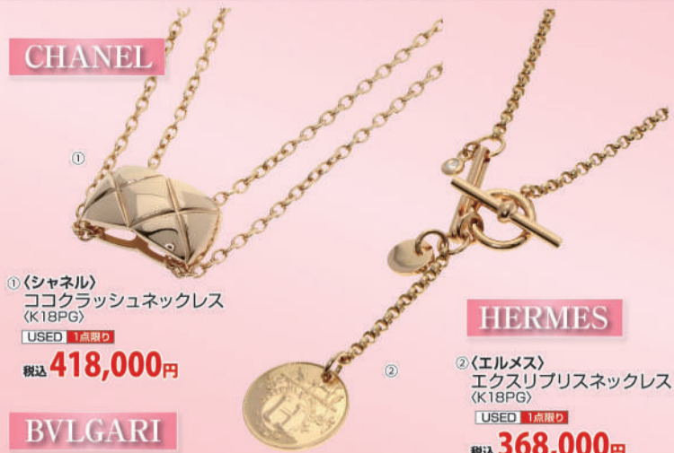
①<シャネル> ココラッシュネックレス (K18PG) USED 1点限り 税込 418,000円