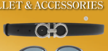
⑤<フェラガモ> ガンチーニベルト 未使用品 1点限り 税込 22,000円