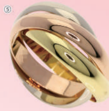
⑤<カルティエ> トリニティリング (K18/#51) USED 1点限り 税込 308,000円