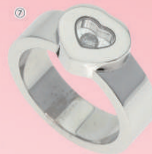
⑦<ショパール> ハッピーダイヤモンドリング (K18WG/#13) USED 1点限り 税込 358,000円