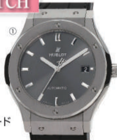
①メンズ(ウブロ) クラシック フュージョン(TV/ラバー) 税込 600,000円