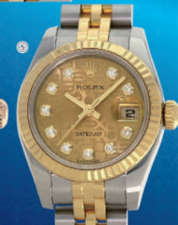
⑪メンズ(ロレックス) デイトジャスト162336(ss/yc) ..... 税込 1,050,000円