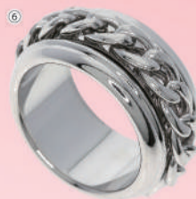
⑥<ピアジェ> ポゼションチェーンリング (K18WG/#51) USED 1点限り 税込 528,000円