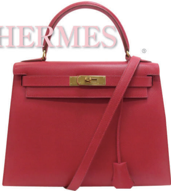
①(エルメス) ケリー28(外縫い) USED 1点限り 税込 1,700,000円