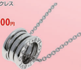
③<ブルガリ> B-zero1ネックレス (K18WG) USED 1点限り 税込 318,000円