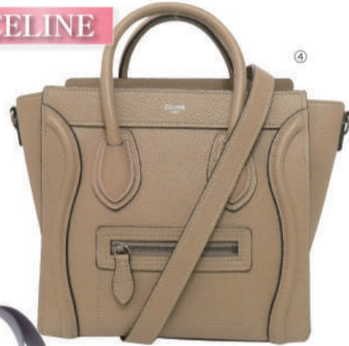
④(セリーヌ) ラゲージナノ USED 1点限り 税込 198,000円