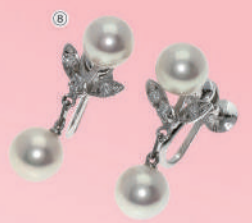
⑧<ミキモト> パール/ダイヤモンドリング (K14WG) USED 1点限り 税込 78,000円