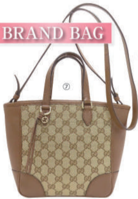
⑦(グッチ) 2Wayバッグ USED 1点限り 税込 90,000円